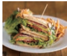
👍 BLTA サンドウィッチ (ベーコン/レタス/トマト/アボカド) BLTA SANDWICH (BACON, LETTUCE, TOMATOES AND AVOCADO) ¥1,580