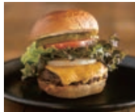
👍 クラシック チェダーチーズバーガー CLASSIC CHEESE BURGER ¥1,780