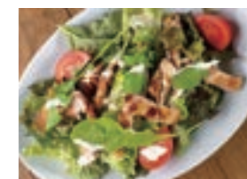
グリルチキンサラダ GRILLED CHICKEN SALAD ¥1,680