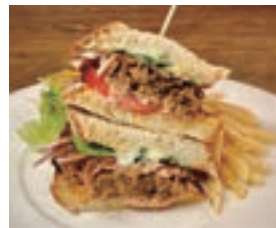
🍴 自家製プルドポークの サンドウィッチ HOMEMADE PULLED PORK SANDWICH ¥1,480