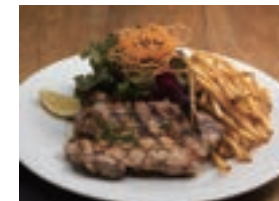
👍 グリルチキン GRILLED CHICKEN ¥1,480