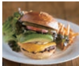
アボカド チーズバーガー AVOCADO CHEESE BURGER ¥1,830