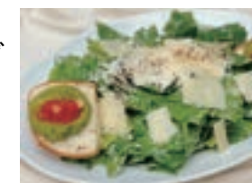
シーザーサラダと アボカドトースト CAESAR SALAD WITH AVOCADO TOAST ¥1,580