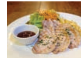
霧島オリーブポークのグリル GRILLED OLIVE PORK FROM KIRISHIMA ¥1,480