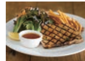
グリルフィッシュ GRILLED FISH ¥1,980