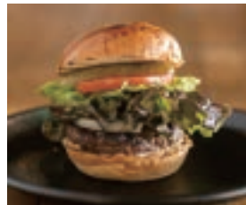
クラシックバーガー CLASSIC BURGER ¥1,680